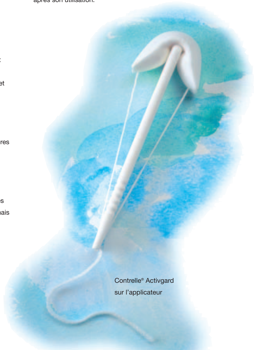
Contrelle® Activgard sur l'applicateur

Il doit être retiré avant tout rapport sexuel. Son utilisation durant la grossesse est soumise à l'avis médical. Pendant les règles, l'Activgard sera utilisé seulement avec des protections périodiques externes et sera changé toutes les 4 à 6 heures. Il ne sera jamais utilisé avec des tampons périodiques internes.